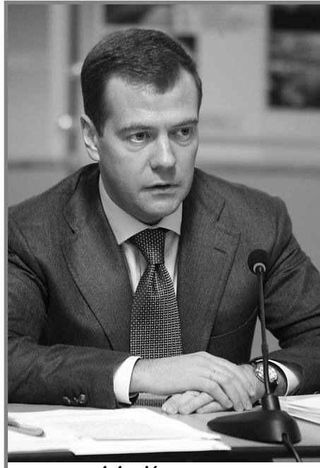
Д.А. Медведев - президент Российской Федерации

5 ноября 2008 года Москва, Большой Кремлевский дворец