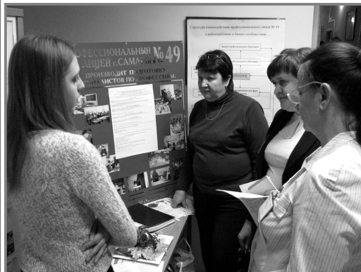
Знакомство с выставочной экспозицией инновационных проектов