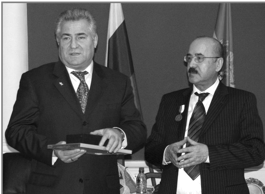
Председатель совета ректоров Самарской области, ректор СамГМУ академик Г.П. Котельников и заместитель председателя Правительства Самарской области - министр экономического развития инвестиций и торговли Г.Р. Хасаев.