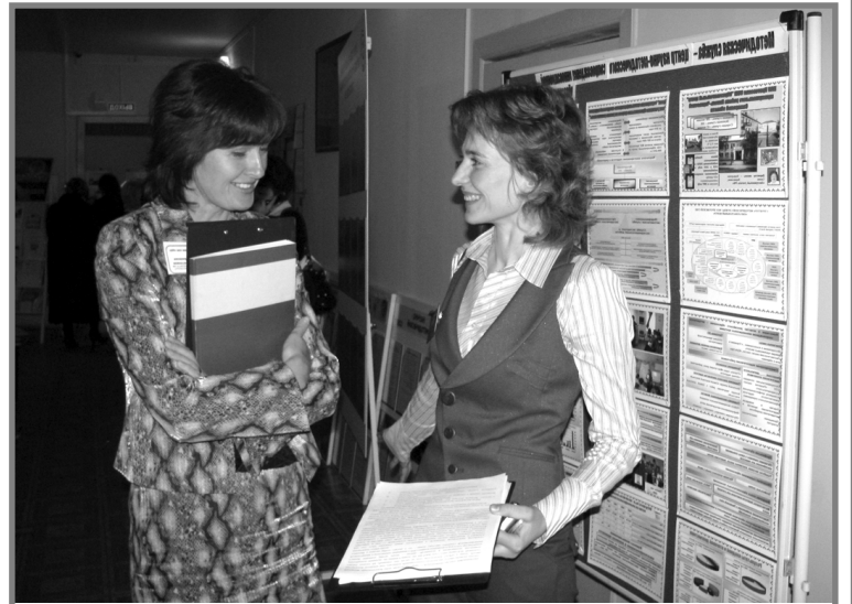
Первые эмоции после презентации

- МОУ Масленниковская средняя общеобразовательная