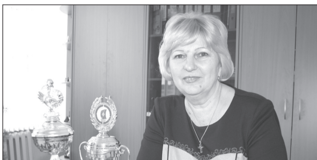
НЕВОЗМОЖНО ЗАПОМНИТЬ ВСЁ