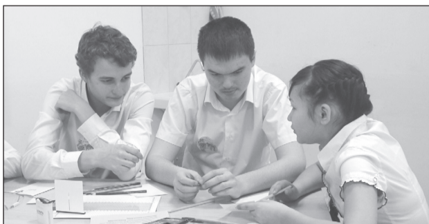
КАЖДЫЙ НОВЫЙ МИР ИНТЕРЕСЕН