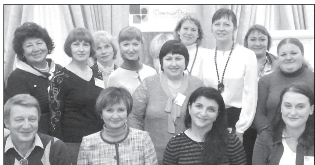
«ОСОБЫЕ ДЕТИ, ОСОБЫЕ ТЕХНОЛОГИИ» СТР. 3