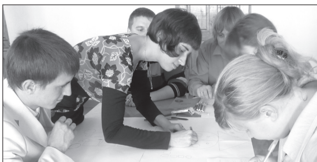
«ВМЕСТЕ МЫ СМОЖЕМ ВСЁ!» СТР. 6