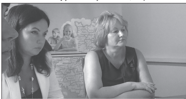
ИТОГИ И ПЕРСПЕКТИВЫ