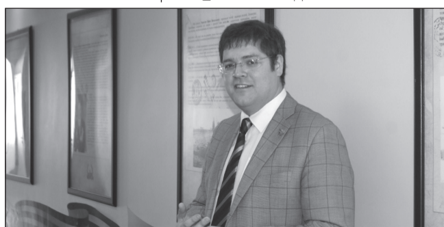
УСПЕХ МОЛОДОГО ПЕДАГОГА