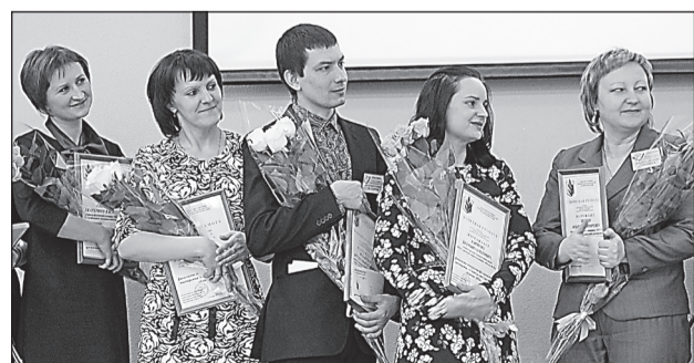
ПЯТЁРКА ЛУЧШИХ ПЕДАГОГОВ