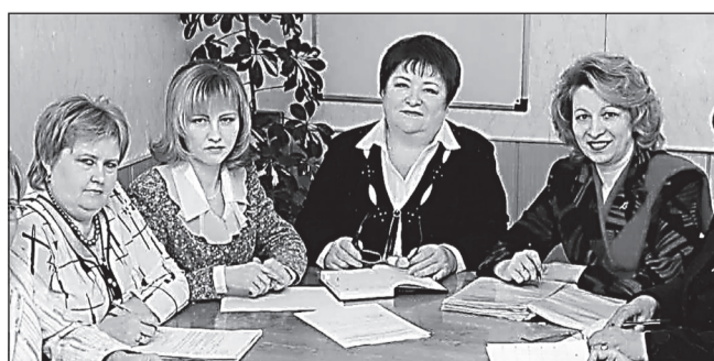
РАЗВИТИЕ В УСЛОВИЯХ МАЛОГО ГОРОДА